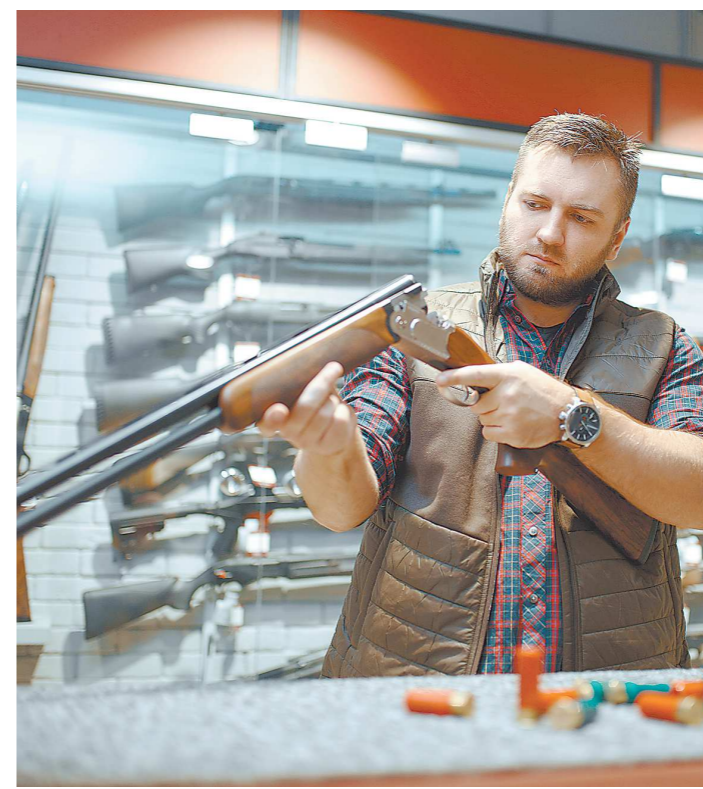
Оружие с особыми типами стволов «ланкастер» и «парадокс» перешло в категорию нарезного