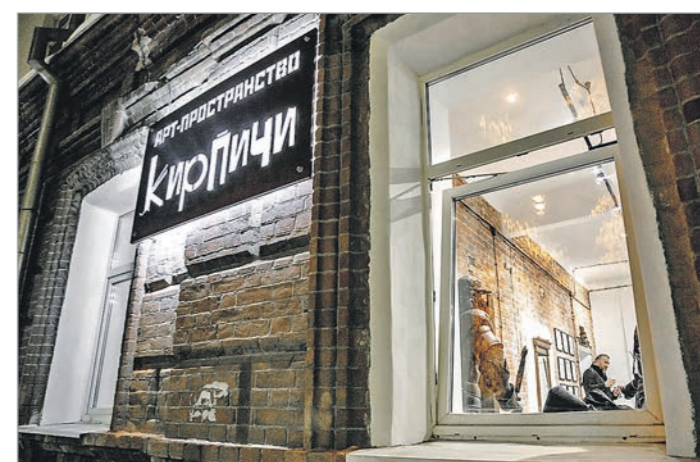
Новое арт-пространство уже принимает гостей

кинскую эпоху, попросил однажды закрыть себя в доме-музее Пушкина на ночь. Вспомнив об этом, осторожно спрашивая Полну: вечерами, когда музей покидают посетители, не было ли соблазна присесть, например, в маминское кресло-качалку. «Почувствовать...» «Что вы?! – взгляд с недоумением. «У себя такого не позволяем». Ответ принят, но... жаль. Наука постигает писателя от ума, логики, фактов. Но эмоционально оно прошибает сильнее. Ну, нельзя заночевать в доме Мамина-Сибиряка. Нельзя присесть на кресло писателя. Тогда – просто походите по комнатам в одиночку. Поскрипите деревянными половицами. Прикройте вышущую угловую круглой печи. Почините своё изображение в пузатом самоваре. Выитайте в автограф писателя в его воспоминаниях «Из далёкого прошлого». А потом... Достаньте сотовый, наведите фокус на заинтересовавший экспонат и – отправляйтесь в XIX век, к Дмитрию Наркисовичу.