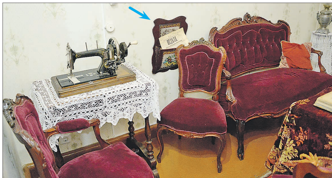
В комнате мамы писателя не пропустите взглядом газетницу. Они стали появляться и в современных домах – стильные, лаконичные. Но такой нарядной сегодня не встретишь...