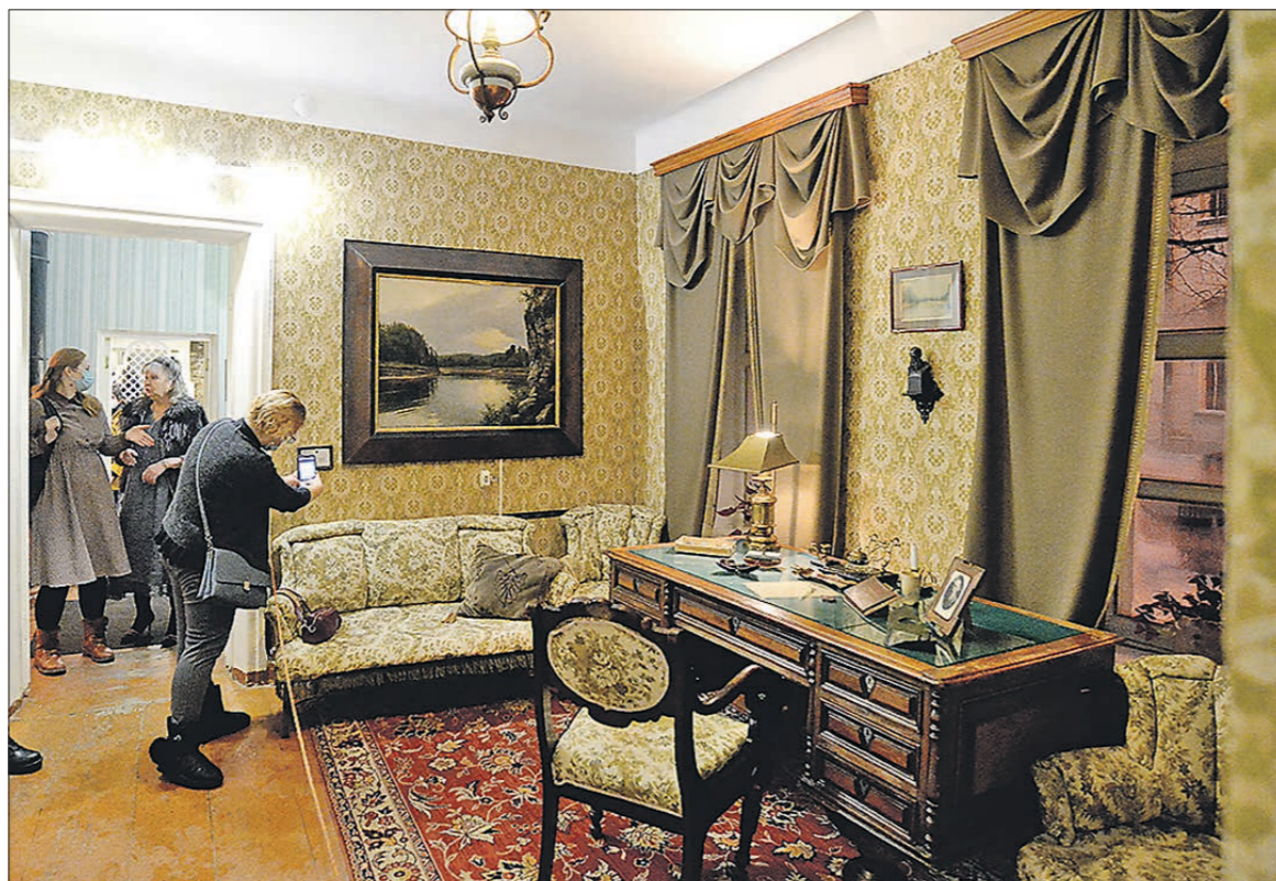
Уже сегодня создатели гида «Artefact» создают: в 2023-м в дом-музей уральского классика обязательно придут гости Екатеринбурга-юбилея или... участники Универсиады

Нацпроект «Культура» позволил объёмно, в дополненной реальности представить 40 наиболее значимых экспонатов дома-музея. Как отбирались эти 40 – отдельная история. Требовалось соблюсти множество технических условий. Знаменитое кресло-качалка писателя? Безусловно, интересно. Но оно подвижно. А потому не с каждого ракурса телефон посетителя может «считать» его, поймать информацию. Старинный самовар в гостиной? Тоже любопытно. Но он бликует со всех точек.