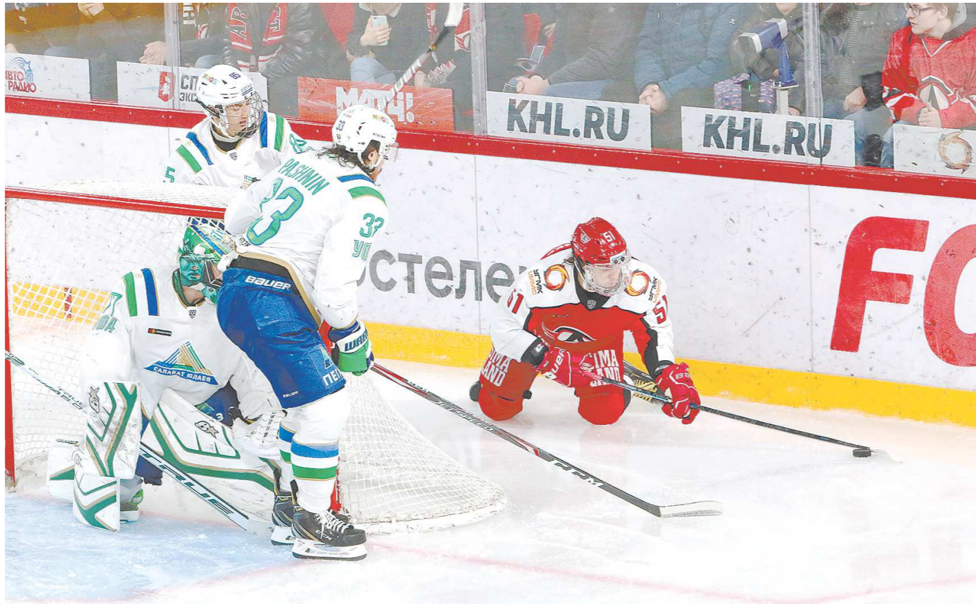
В прошлые годы «Автомобилист» играл с «Салаватом Юлаевым» (как и с другими грандами Востока) по четыре раза за сезон. По предложенной схеме будет всего по два матча: один дома, один – в гостях

Вторую конференцию (Якушева) составят 10 команд: «Сибирь», «Нефтехимик», «Торпедо», «Барыс», «Автомобилист», «Амур», «Витязь»