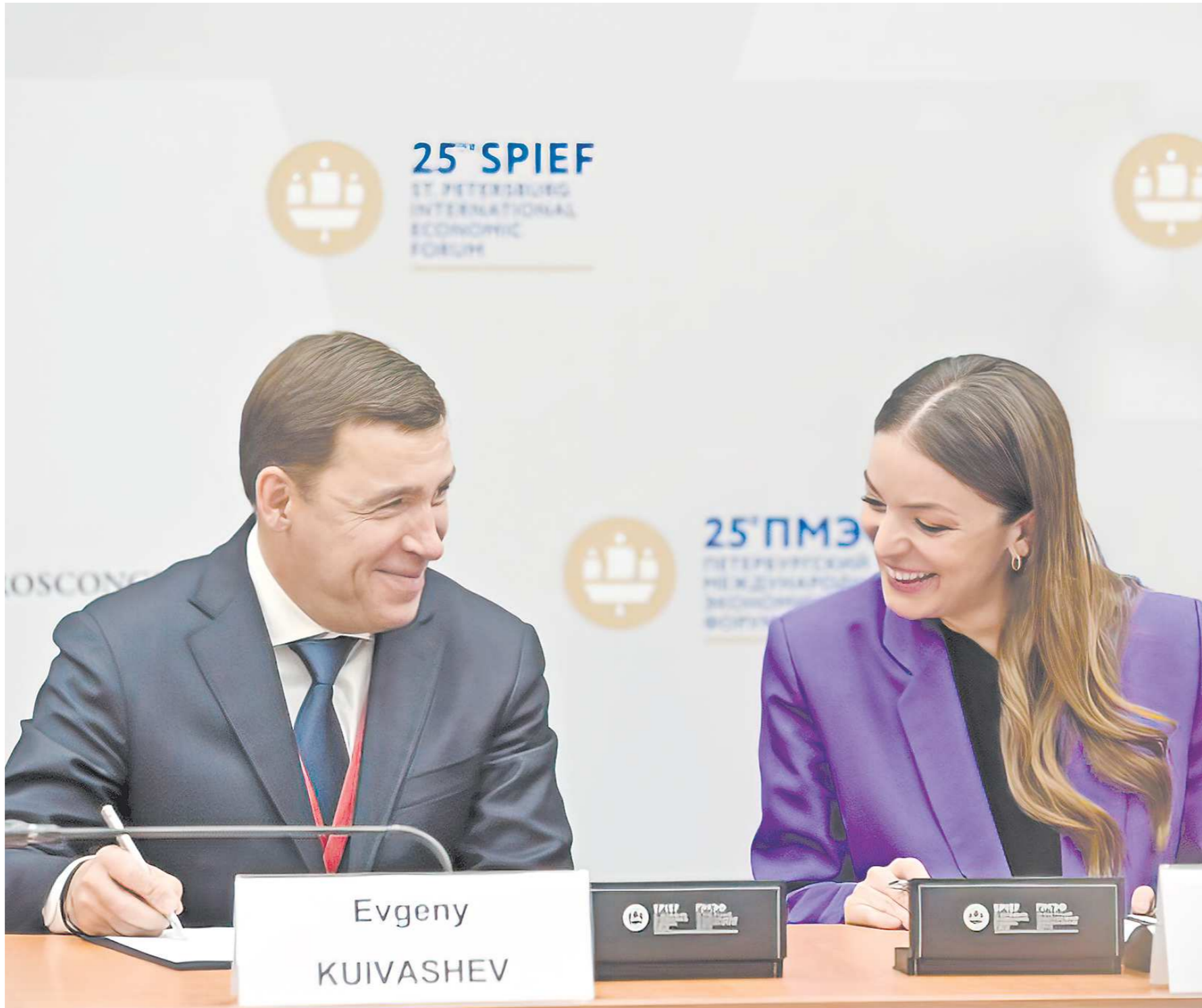
Главы регионов Большого Урала, среди которых был и Евгений Куйвашев, подписали соглашение с руководителем Ростуризма Зариной Догузовой о совместном развитии внутреннего и въездного туризма

«Система сложилась, и она работает, но главное – это активность и эффективность местных команд! Все в руках регионов, и ресурсы у них есть, но это, конечно, не значит, что федеральное правительство отходит от этого вопроса. Мы также будем взаимодействовать с регионами и тем, у кого по каким-либо причинам не получается, будем помогать», – пообещал Максим Решетников.