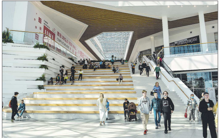
Некоторые екатеринбуржцы пришли в торговый центр в первый же день его работы

Заявленные магазины всегда привлекают большое количество покупателей. О МЕСТОПОЛОЖЕНИИ – Так как новый торговый центр располагается вблизи объездной магистрали, жители Верхней Пышмы, Среднеуральска, Берёзовского и окрестных сельских населённых пунктов удобно будет добираться до этого торгового центра, а не кружить по всему городу, добираясь до «Гринвич», «Пассажа», «Карнавала» и других крупных ТЦ. О СРАВНЕНИИ С ТРЦ «КОМСОМОЛ» – Надеюсь, что Veer Mall не повторит судьбу «Комсомолец» (этот торговый центр тоже открывался в расчёте на покупателей с окраины города и из близлежащих населённых пунктов, но в силу разных причин практически опустел. – Прим. ред. ). Основная беда упомянутого ТЦ – транспортная недоступность. Расположение же Veer Mall, наоборот,