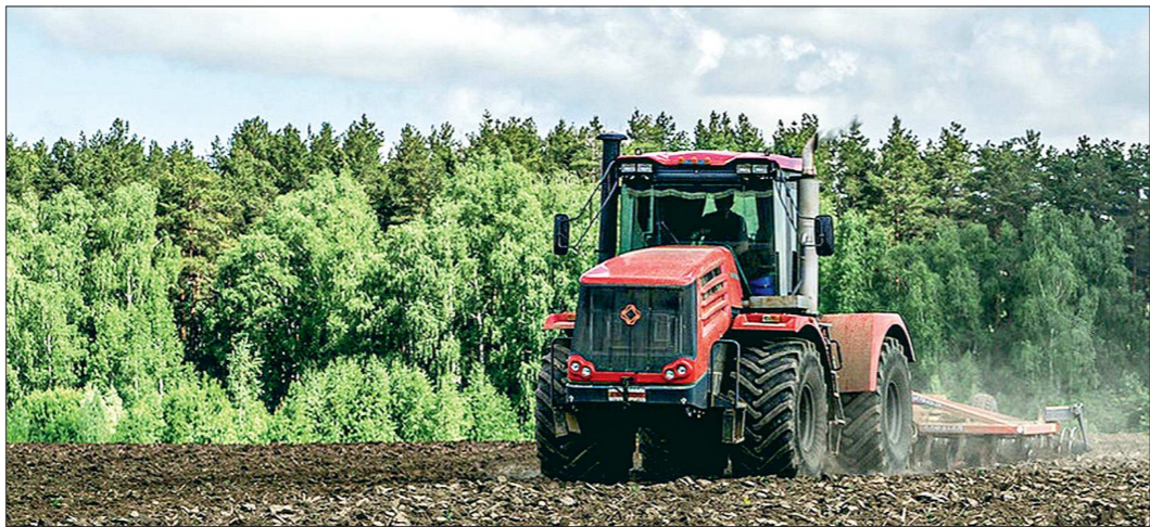
У предприятия внушительная техническая база – 13 тракторов, три комбайна и другая необходимая для полевых работ техника

На базе ООО «Некрасово-1» возле Башкарки стройными рядами выстроилась техника: тракторы, комбайны, бороны. В центре композиции – зерноочистительный комплекс с космическими очертаниями. А вокруг базы на многие километры раскинулись поля, где дружно всходят рожь и ячмень. С трудом верится, что всего пять лет назад здесь были поросшие кустарником и сорняками земли. Теперь в поля вернулась техника, и Горноуральский городской округ получил опору для укрепления экономики.