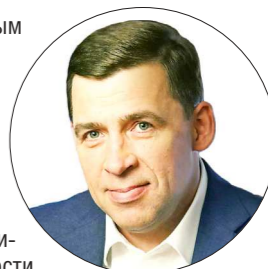
ДЕПАРТАМЕНТ ИНФОРМАЦИОННОЙ ПОЛИТИКИ

483 кандидата было зарегистрировано на праймериз в Свердловской области, в том числе 156 кандидатов в Госдуму, 327 кандидатов в региональное Законодательное собрание.