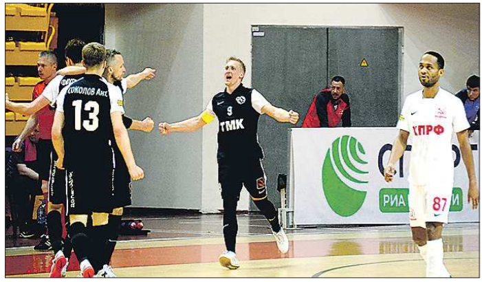
«Синара» находится в одной победе от финала Суперлиги