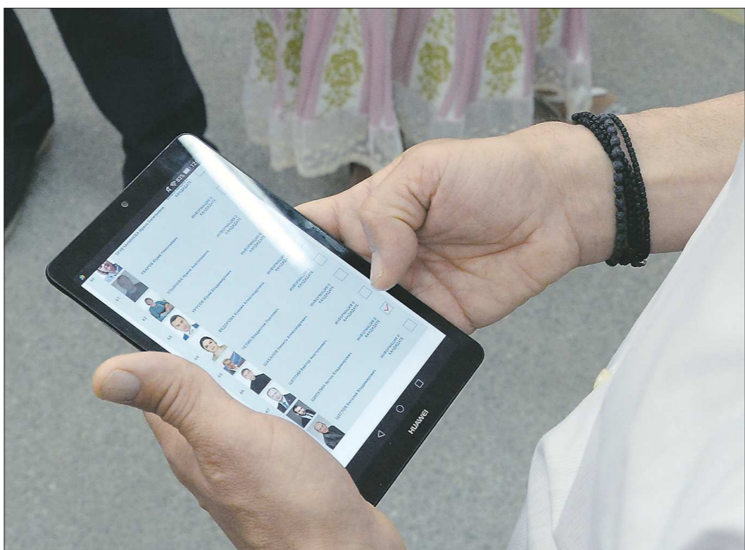
Первые праймериз полностью проходили онлайн – поддержать кандидатов можно было на сайте pg.er.ru

В целом по России участие в праймериз приняли более 11 миллионов человек. Эксперты считают, что процедура стала самой мас-