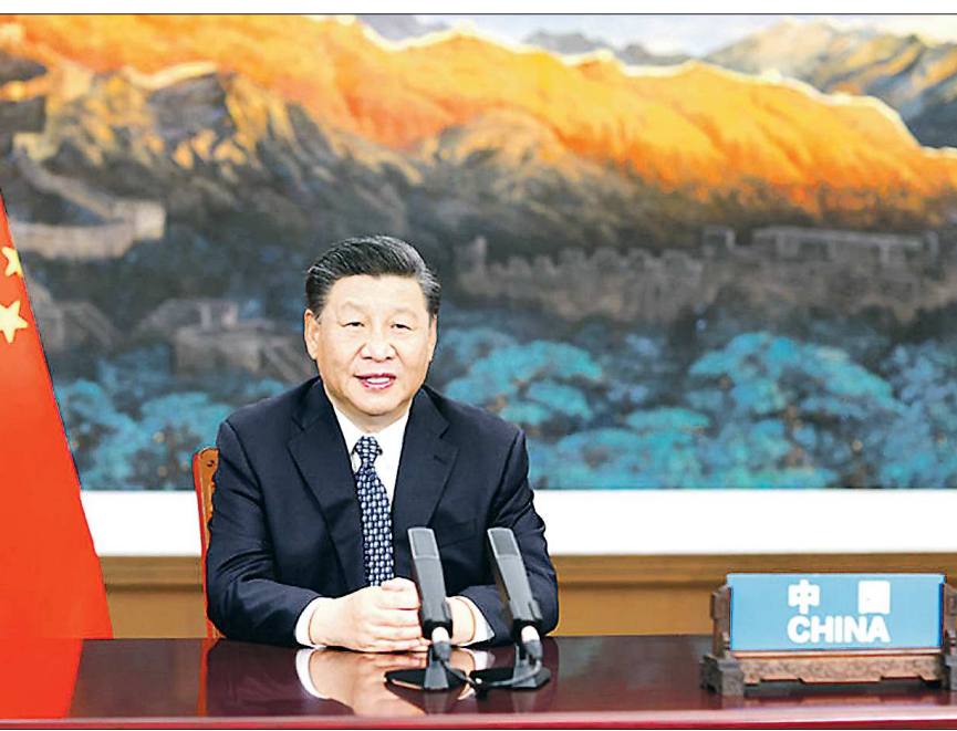
Председатель КНР Си Цзиньпин уверен, что сформировать сообщество единого здравоохранения человечества можно только совместными усилиями

Хотя текущий мировой кризис, вызванный COVID-19, длится уже полтора года, за этот период страны «двадцатки» научились эффективно противодействовать распространению коронавируса и выработали комплексный алгоритм действий по предотвращению масштабных вспышек инфекций. Ведь как показал опыт, социально-экономические последствия пандемий сопоставимы с ущербом от региональных войн и локальных конфликтов. Поэтому любое промедление в