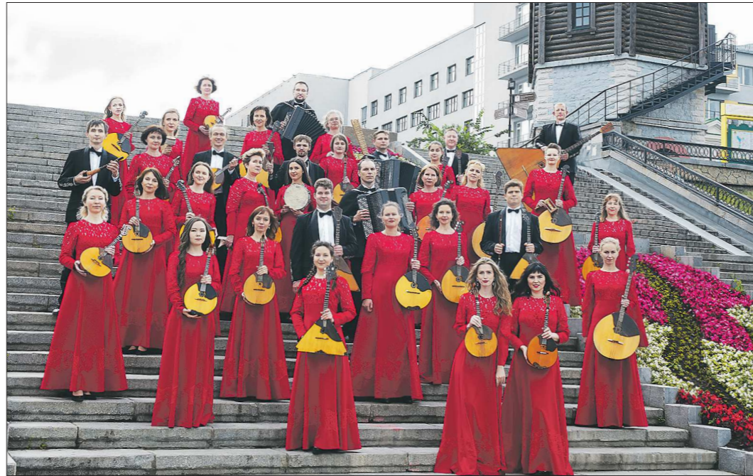
Уральский государственный русский оркестр, как и десятки их коллег-коллективов по стране, – по определению красноречивый символ и образ России. А уж когда заиграют...

– Аналогичные объединения площадок есть ещё в России? Или это новый вопрос, с учетом отношения общества к народному жанру в последние годы?