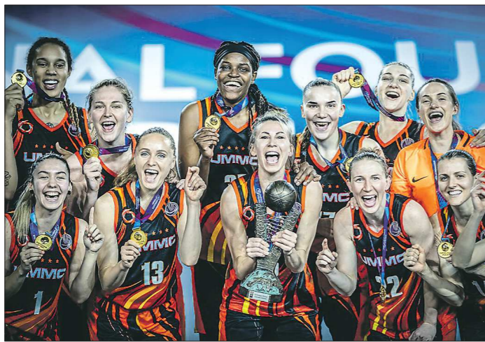
18 апреля 2021 года команда «УГМК» шестой раз выиграла Евролигу ФИБА