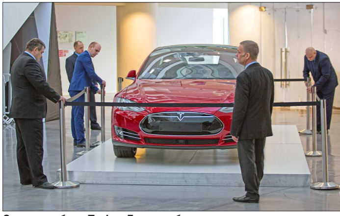
Электрокары Tesla в Екатеринбурге пока в диковинку

Сведения о количестве автомобилей с электрическим двигателем в Свердловской области разнятся. По данным регионального управления ГИБДД, на учёт поставлено 179 электрокаров. По данным «Автостата», на Среднем Урале зарегистрировано 124 электрокара, причём 19 из них приобретены за январь-апрель 2021 года (для сравнения: за январь-апрель 2020 года приобретено только 4 электрокара). – В региональном рейтин-