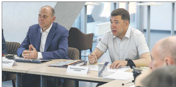
Евгений Куйвашев и Дмитрий Пумпянский на заседании попечительского совета «Урала»

Подготовлено в соответствии с критериями, утвержденными приказом Департамента информационной политики Свердловской области от 09.01.2018 №1 «Об утверждении критериев отнесения информационных материалов, публикуемых государственными учреждениями Свердловской области, к социально значимой информации».