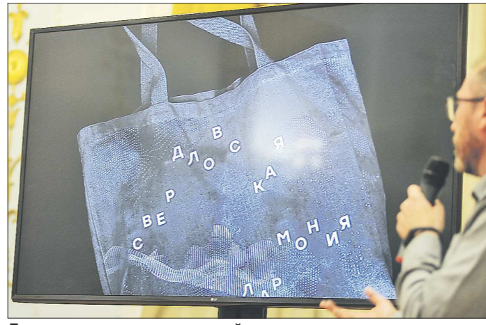
Для поклонников классической музыки планируется выпуск сувенирной продукции с новым логотипом