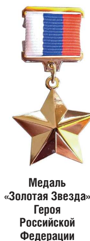
Медаль «Золотая Звезда» Героя Российской Федерации