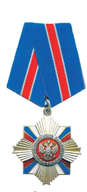
Орден «За военные заслуги»

краевед и тоже фронтовик, задумал сделать в селе музей лётчика-героя, а я помогал ему таблички писать – у меня почерк был красивый.