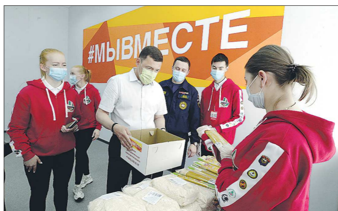
Губернатор помог волонтерам собрать продуктовые наборы и погрузить их в автомобиль для развоза по заявкам свердловчан

Подготовлено в соответствии с критериями, утвержденными приказом Департамента информационной политики Свердловской области от 09.01.2018 №1 «Об утверждении критериев отнесения информационных материалов, публикуемых государственными учреждениями Свердловской области, в отношении которых функции и полномочия учредителя осуществляет Департамент информационной политики Свердловской области, к социально значимой информации».