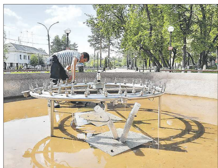
По проекту у нового фонтана три водных контура, от центра чаши вверх поднимаются струи воды с подсветкой

Подготовлено в соответствии с критериями, утверждёнными приказом Департамента информационной политики Свердловской области от 09.01.2018 №1 «Об утверждении критериев отнесения информационных материалов, публикуемых государственными учреждениями Свердловской области, в отношении которых функции и полномочия уполномоченного осуществляет Департамент информационной политики Свердловской области, к социально значимой информации».