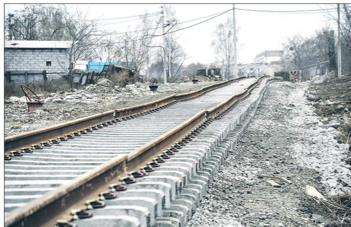
За всё время строительства трамвайной линии назывались как минимум пять разных сроков его завершения