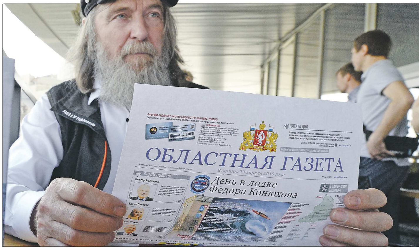
Легендарный путешественник Фёдор Кононов побывал в Екатеринбурге и встретился с корреспондентами «Областной газеты», которые внимательно следили за его рекордным вёсельным переходом через Южный океан к мысу Горн