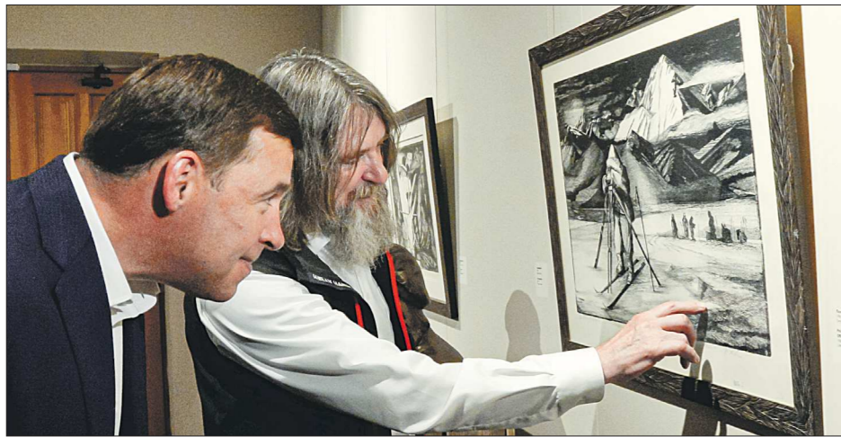
Фёдор Конюхов посетил выставку своих работ в Екатеринбургском музее ИЗО и провёл экскурсию для губернатора Евгения Куйвашева

Можно сказать, что в ближайшие две недели творчество Фёдора близко мне не только эмоционально, но и территориально!