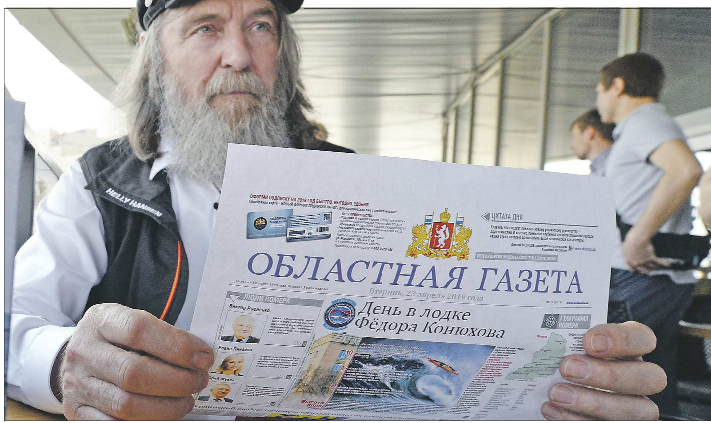
Легендарный путешественник Фёдор Кононов побывал в Екатеринбурге и встретился с корреспондентами «Областной газеты», которые внимательно следили за его рекордным вёсельным переходом через Южный океан к мысу Горн