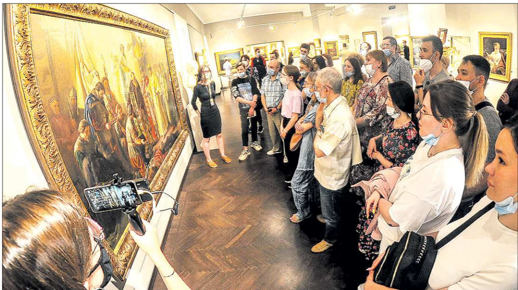
Аншлаг в Екатеринбургском музее ИЗО был даже на постоянной экспозиции

В минувшие выходные в Свердловской области прошла акция «Ночь музеев». Мероприятие посетили 117 тысяч человек, онлайн-участники стали ещё 220 тысяч. Нынешняя акция была приурочена к Году науки и технологий в России, Году медреса в Свердловской области и прошла под девизом «Больше, чем музей». Гости принимали 150 площадок в 57 муниципалитетах. Много желающих было посетить Екатеринбургский музей ИЗО, Музей истории Екатеринбурга, Музей архитектуры и дизайна, Дом Поклевских-Козелл, Центр фотографии «Март» и другие площадки.