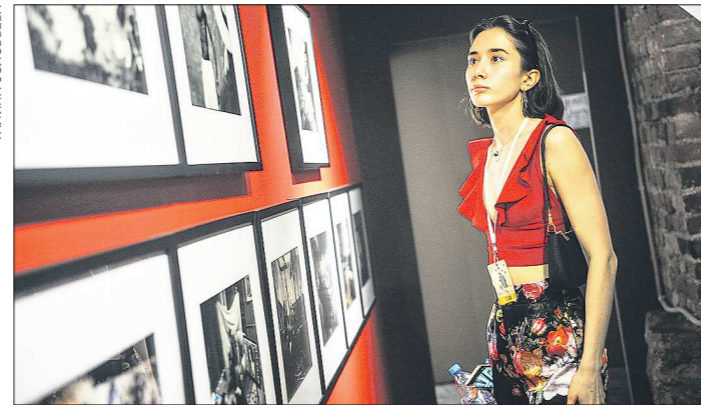
В галерее «Март» посетителей ждала выставка от фешн-фотографа «Мечты. Календарь Пирелли. Альберт Уотсон»

Немузей мусора как раз отметил свой второй день рождения. Сотрудники подготовили программу «Жить осознанно – тренд 2021». Гости послушали лекции о том, как давать вещам вторую жизнь, мыслить экологично и какие растения можно завести у себя дома