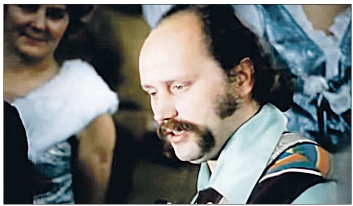
Сам Владимир Мулявин снимался в художественных фильмах, но сериала по его биографии ещё не делали