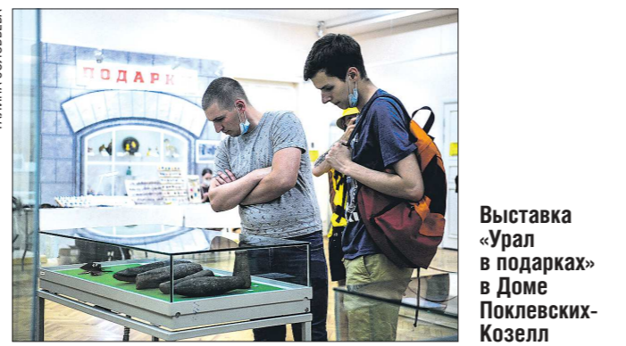
Выставка «Урал в подарках» в Доме Поклевских-Козелл