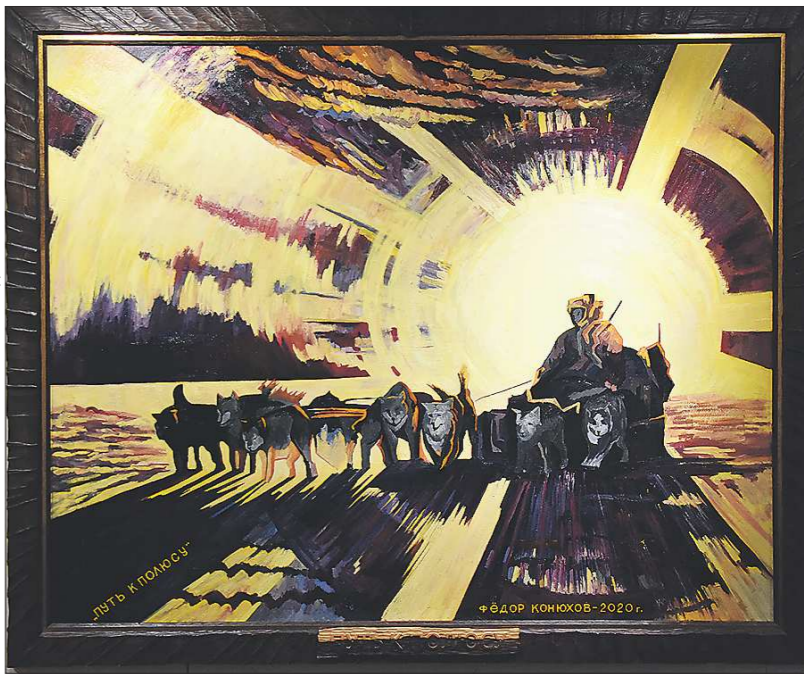
«Путь к полюсу». Фёдор Конюхов является первым человеком в мире, достигшим пяти полюсов Земли

Организаторы выставки признаются, что планировали