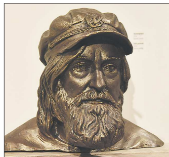
Ещё один автопортрет Фёдора Конюхова, но уже в бронзе

А пока к экспозиции. Уверены, что многие до сих пор ассоциируют Фёдора Конюхова исключительно с путешествиями, которые неизбежно затмевают другие его ипостаси — священнослужение и искусство. А жаль. Нам посчастливилось оказаться в часовне Фёдора в Москве, где находится и его мастерская. Это очень самобытное место: там, как в музее, можно провести целый день,