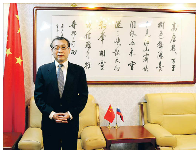
Как отмечает господин Цуй Шаочунь, большой вклад в дружбу двух стран внесло взаимное проведение тематических годов государственного значения