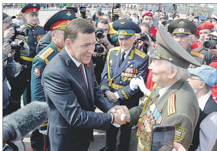
Губернатор Евгений Куйвашев тепло приветствовал ветеранов, пришедших на парад

– Вы принесли мир на нашу землю, подарили нам возможность жить в свободной стране. Мы делаем всё, чтобы защитить вас от любых невзгод, создать вам достойные условия жизни. Завбота о ветеранах – это приоритет государства и гражданский долг каждого. 9 Мая – это ваш праздник. Вы – его главные герои, – сказал