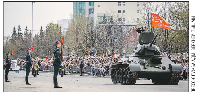
Фишкой парада в Верхней Пышме стало участие исторической военной техники

Сам парад, тоже по давней нашей традиции, открыла рота юных барабанщиков Екатеринбургского суворовского военного училища. Кстати, в отличие от прошлых лет, это старейшее на Урале учреждение довузовского военного образования на нынешнем параде впервые представляли не только юные барабанщики, но и полнокровная парадная «коробка» из воспитанников старших классов. Заметим, что из 20 парадных расчётов, принявших участие в нынешнем торжественном марше, были и другие, сфор-