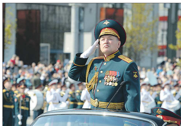
Парад принимал командующий войсками ЦВО генерал-полковник Александр Лапин