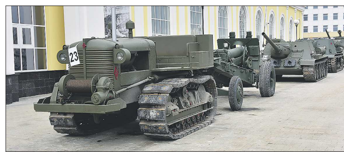
Американский трактор «Аллис-Чалмерс» – единственный в России. Он будет буксировать гаубицу-пушку производства Мотовилихинского завода (Пермь)