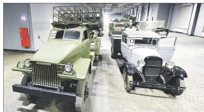
Автомобиль «Студебекер» (слева) с размещённой на нём установкой БМ 31-12 – «Андрюшей». Справа – автомобиль ГАЗ-ААА