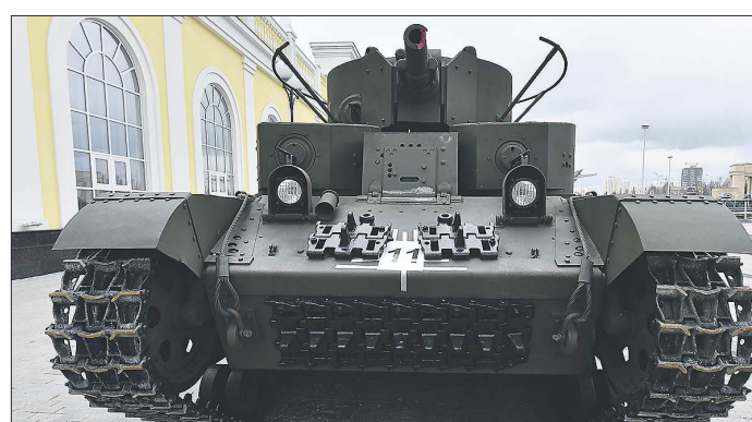
Т-28 – малоизвестная страница советского танкостроения