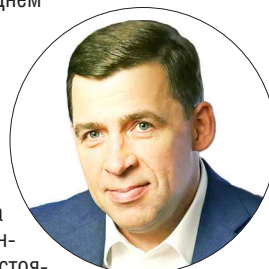
ДЕПАРТАМЕНТ ИНФОРМАТИКИ СО

Губернатор Свердловской области Евгений КУЙВАШЕВ