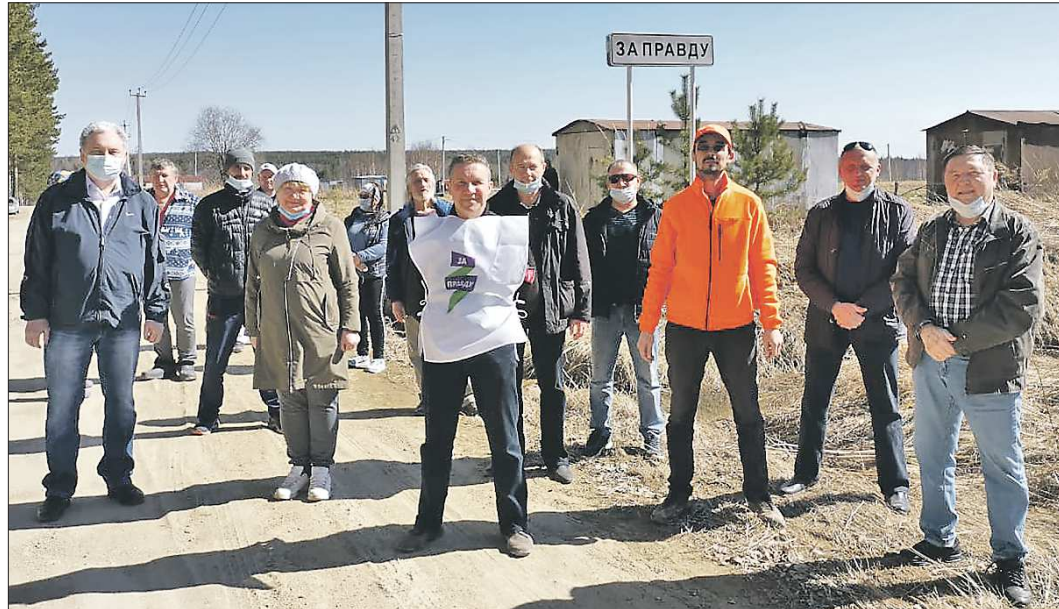
Жители садового товарищества «Сосновское» верят, что им удастся изменить статус их СНТ на посёлок «За правду», и он появится на карте Свердловской области

Когда четыре года назад я занимался получением официального адреса, чтобы люди могли прописаться в своих домах, то интересовался в Главархитектуре администрации Екатеринбурга и в других инстанциях, нельзя ли присвоить нам статус посёлка? – рассказывает