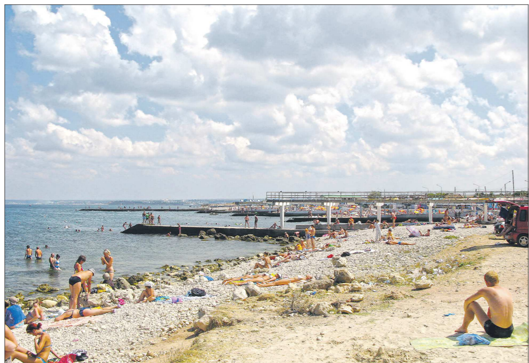
Отдых на российском море выходит дороже, чем в любимой многими Турции. При этом туристический сезон на наших курортах короче, а качество отдыха нередко уступает зарубежному

Стоимость и неудобство зарубежным туристам добавляет авиасообщение – улететь туда сейчас можно далеко не из каждого российского аэропорта. Из Екатеринбурга, например, пока можно улететь только в Дубай, Шарджу, Рас-эль-Хайм, Ларнаку и Каир. Остальные доступные из аэропорта Кольцово за-