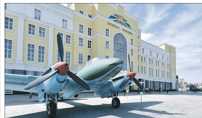
Создатели музея обещают, что в дальнейшем уникальная экспозиция будет пополняться

Выставочный центр «Крылья Победы», посвящённый военной авиации времён Великой Отечественной войны, открылся вчера в Верхней Пышме, сообщает пресс-служба УГМК.