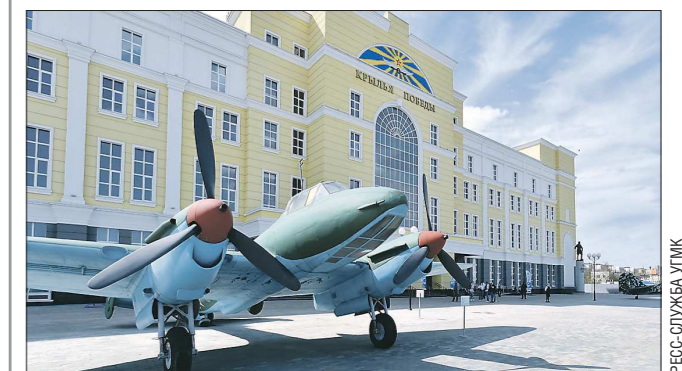
Создатели музея обещают, что в дальнейшем уникальная экспозиция будет пополняться

Выставочный центр «Крылья Победы», посвящённый военной авиации времён Великой Отечественной войны, открылся вчера в Верхней Пышме, сообщает пресс-служба УГМК.