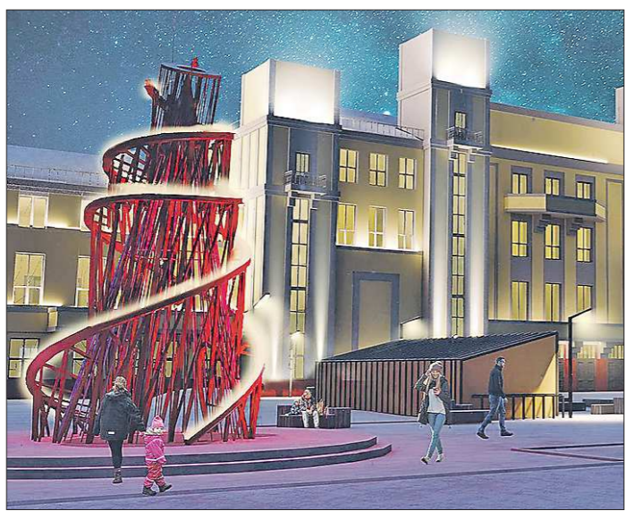
Изяюминка проекта в Серове – макет башни Татлина, которая вошла в историю как символ конструктивизма