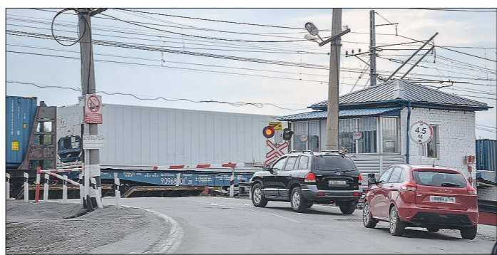
За нарушение ПДД на железнодорожном переезде водителя могут оштрафовать или лишить прав на срок от трёх до шести месяцев

Подготовлено в соответствии с критериями, утверждёнными приказом Департамента информационной политики Свердловской области от 09.01.2018 №1 «Об утверждении критериев отнесения информационных материалов, публикуемых государственными учреждениями Свердловской области, в отношении которых функции и полномочия уполномоченного лица осуществляет Департамент информационной политики Свердловской области, к социально значимой информации».