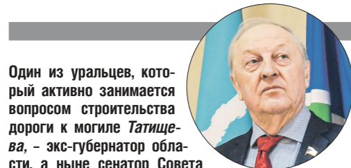
Один из уральцев, который активно занимается вопросом строительства дороги к могиле Татищева – экс-губернатор области, а ныне сенатор Совета Федерации РФ Задард РОССЕЛЬ .

Подготовлено в соответствии с критериями, утверждёнными приказом Департамента информационной политики Свердловской области от 09.01.2018 №1 «Об утверждении критериев отнесения информационных материалов, публикуемых государственными учреждениями Свердловской области, в отношении которых функции и полномочия учредителя осуществляет Департамент информационной политики Свердловской области, к социально значимой информации»