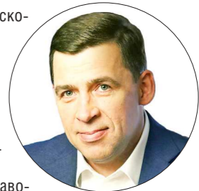
Губернатор Свердловской области Евгений КУЙВАШЕВ

Благодарю депутатский корпус Свердловской области за продуктивную, добросовестную работу. Желаю здоровья, счастья, благополучия, успехов в законотворческой деятельности, направленной на развитие региона, повышение качества жизни уральцев.