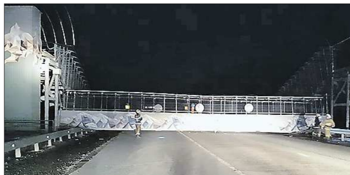
Для ликвидации последствий аварии на ЕКАД выезжали сотрудники МЧС