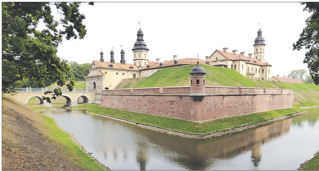
Несвижский замок постройки XVI века включён в список Всемирного наследия ЮНЕСКО. Здесь часто можно увидеть туристов со Среднего Урала