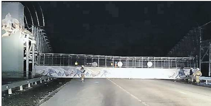
Для ликвидации последствий аварии на ЕКАД выезжали сотрудники МЧС