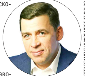
Губернатор Свердловской области Евгений КУЙВАШЕВ

Благодарю депутатский корпус Свердловской области за продуктивную, добросовестную работу. Желаю здоровья, счастья, благополучия, успехов в законотворческой деятельности, направленной на развитие региона, повышение качества жизни уральцев.