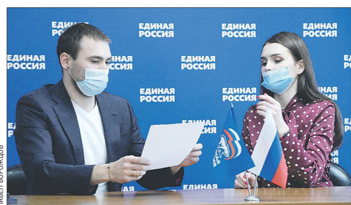
У олимпийского чемпиона остались незаключённые дела