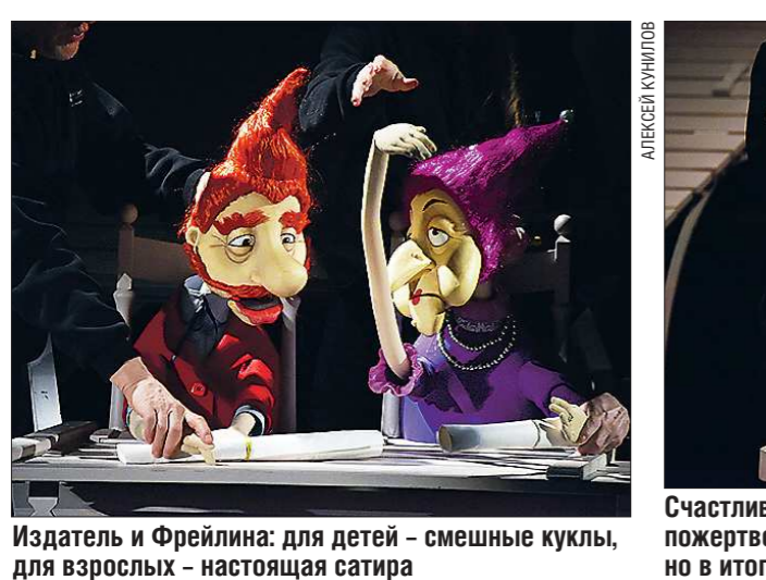
Счастливый Принц и Ласточка пожертвовали собой ради счастья других, но в итоге оказались в куче мусора

Но детям об этом знать пока не обязательно. Всему своё время.