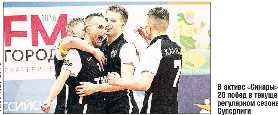
В активе «Синары» 20 побед в текущем регулярном сезоне Суперлиги