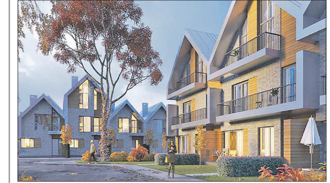
Примерно так Главархитектура Екатеринбурга предлагает оформлять жилые дома

Подготовлено в соответствии с критериями, утвержденными приказом Департамента информационной политики Свердловской области от 09.01.2018 №1 «Об утверждении критериев отнесения информационных материалов, публикуемых государственными учреждениями Свердловской области, в отношении которых функции и полномочия учредителя осуществляет Департамент информационной политики Свердловской области, к социально значимой информации».