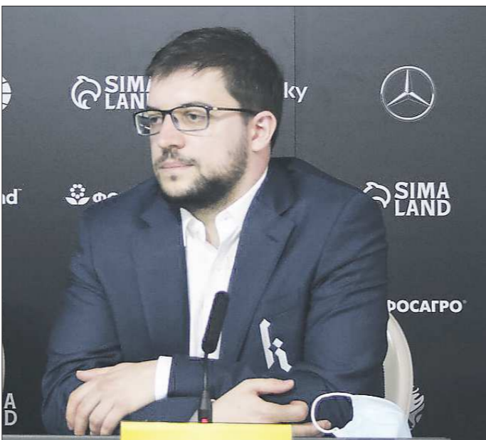
Максим Вашье-Лаграв — промежуточный лидер турнира. По его настрою понятно, что он готов и дальше удерживать свою позицию

Промежуточный лидер — Максим Вашье-Лаграв — отметил, что в прошлом году даже был готов к остановке.