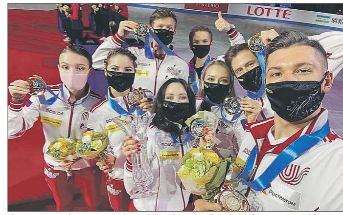
Команда победителей: Анна Щербакова, Евгений Семенов, Михаил Коляда, Elizaveta Tuktamysheva, Виктория Синицина и Никита Кацалапов, Александр Галлямов (снимает) и Анастасия Мишина

По регламенту короткие и произвольные программы на