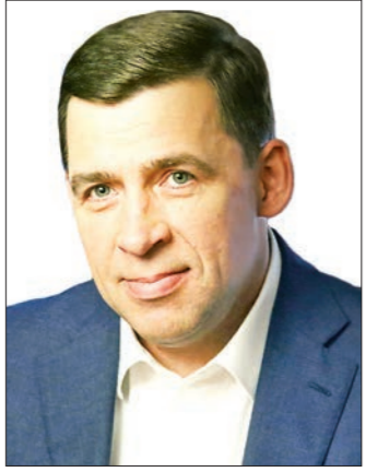
ДЕПАРТАМЕНТ ИНФОРМАТИКИ И СВЯЗИ

Евгений КУЙВАШЕВ, губернатор Свердловской области