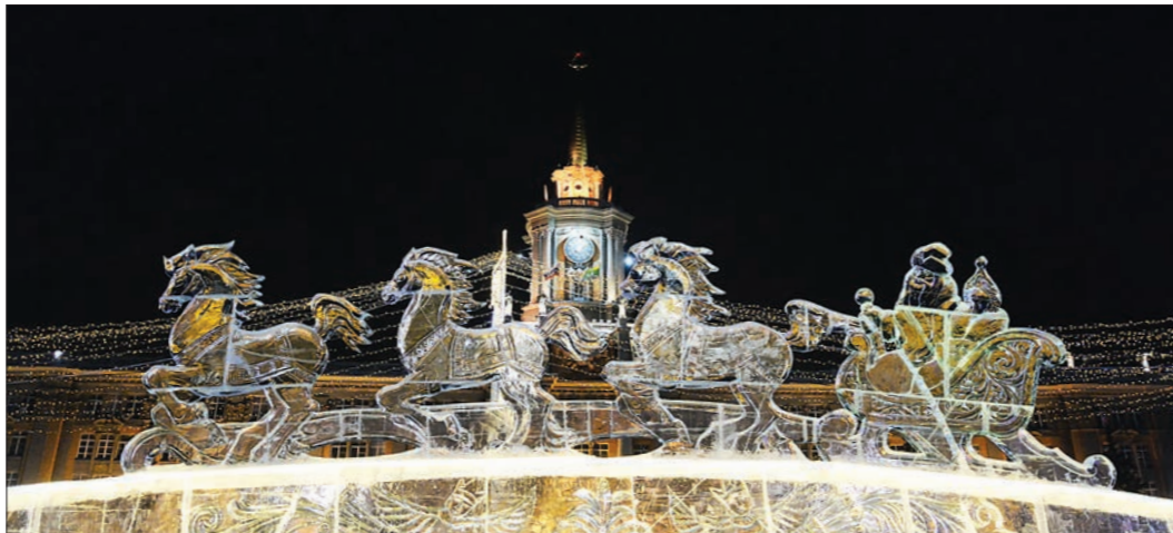
Лёд для скульптур екатеринбургского городка заготавливают в карьере у посёлка Северка. Строители говорят, что там он самый чистый и прозрачный. Специальным ледорезом выпиливаются заготовки размером 1,2 м на 80 см. Толщина всех кубиков льда должна быть 20 см

конечно, создают праздничное настроение, но таких чудес из льда не увидишь. Внучка катается на горках, мы с мужем ходим, скульптуры разглядываем, фотографируемся. Сразу чувствуется Новый год! – отмечает пенсионерка Татьяна Колотовкина .