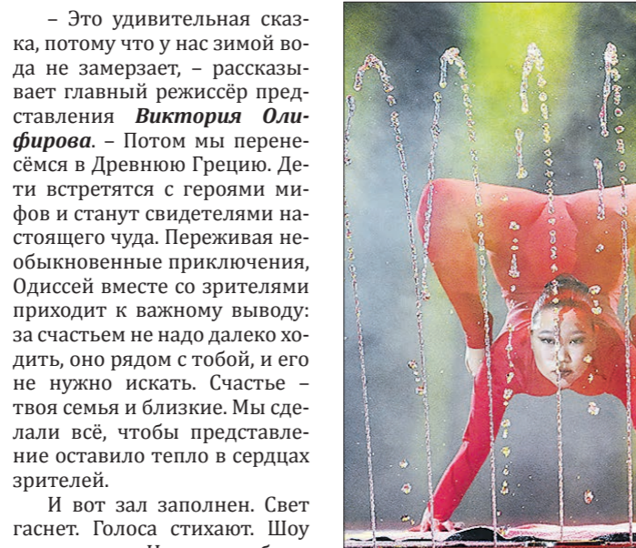
На сцене полное разнообразие цирковых номеров. От акробатов...