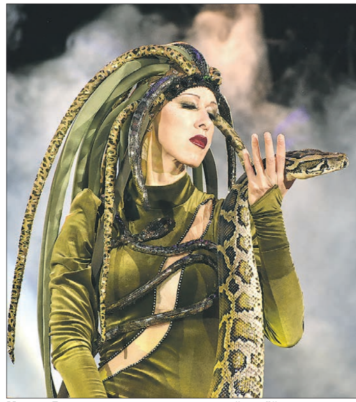
Медуза Горгона выходит на арену с живой змеей

Их вниманию представили шоу «Одиссея». Это действительно уникальная постановка, в которой органично соединились цирк, мюзикл, театр. Более того, действие происходит на воде.