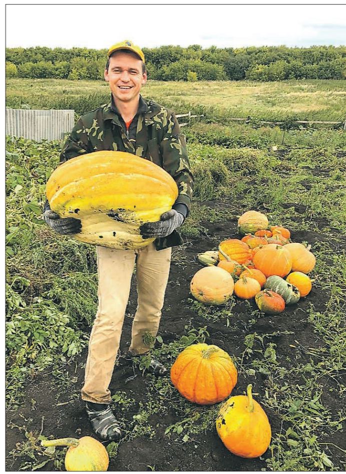
Огромные тыквы и аккуратные тыквовки остаются на грядках вплоть до осени