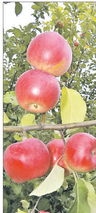
Вес Никулинки – 145–185 граммов, цвет – ярко-красный