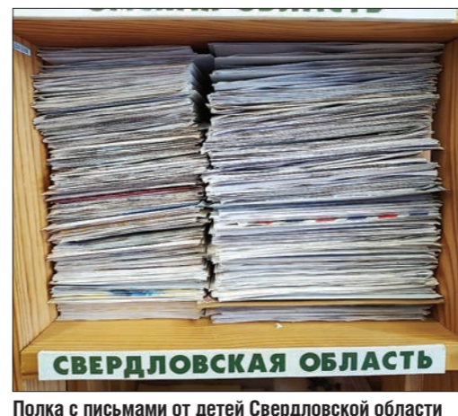
Полка с письмами от детей Свердловской области