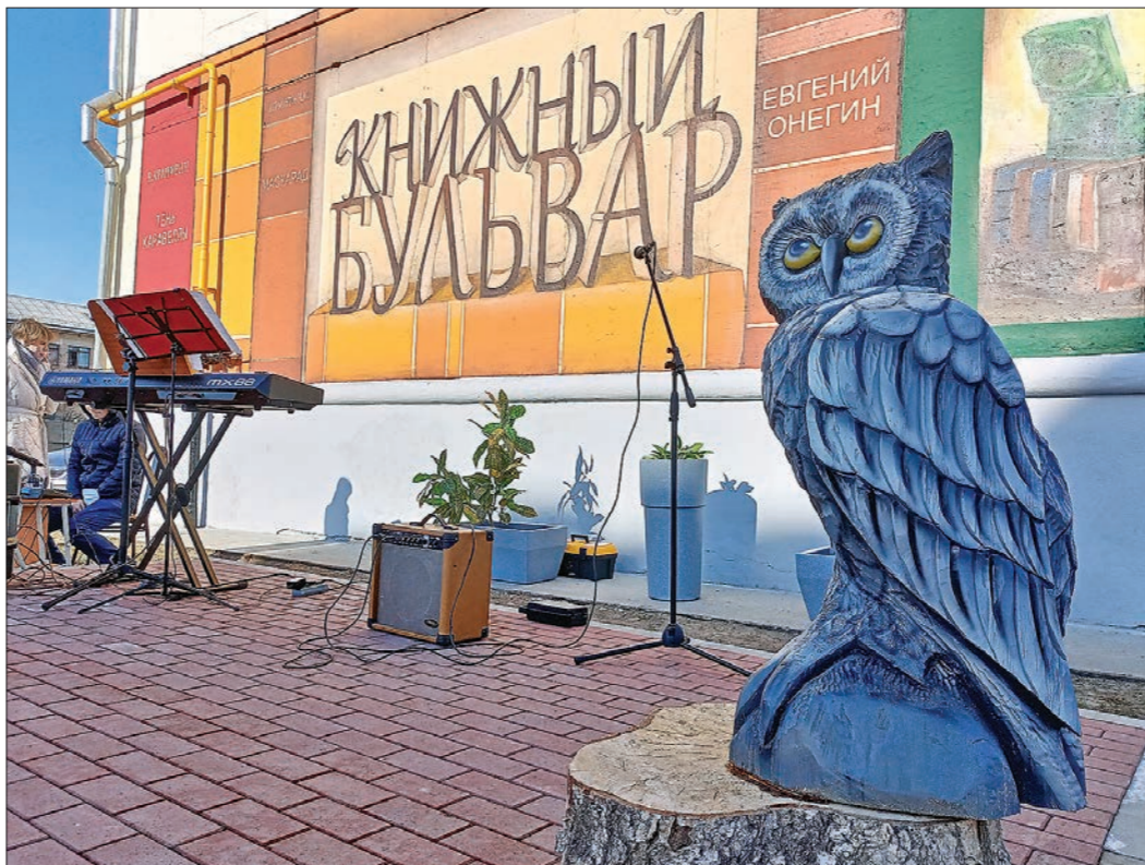
На обустройство уличного пространства возле центральной городской библиотеки Красноуральска в рамках инициативного бюджетирования собрали 2,2 миллиона рублей

● Так, в Красноуральске благодаря поддержке граждан в октябре появилось первое в городе уличное пространство для буккроссинга «Книжный бульвар». Обустроили его на пустышке в пятачке возле центральной городской библиотеки – раньше там стоял пивной ларёк. Идея создания зоны отдыха принадлежит заместителю директора централизованной библиотечной системы Елене Токмаковой. – Чтобы преобразить заброшенный участок, 67 горожан вложили личные средства – в общей сложности 320 тысяч рублей. Ещё два миллиона рублей составила финансовая поддержка местного и регионального бюджетов, а также представители бизнеса, – рассказал глава города Александр Устинов.