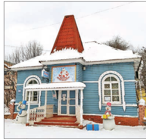
Почтовое отделение Деда Мороза в Великом Устюге