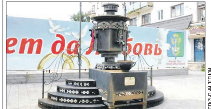
Нижнетуринский самовар был популярным местом для уличных мероприятий и свадебных фотосессий

Пропавший самовар в Нижней Туре, полтора миллиона рублей за привлек, фейковый аккаунт мэра Новоуральска... С этого номера «Облгазета» начинает публиковать подборку самых интересных новостей в уральских территориях.