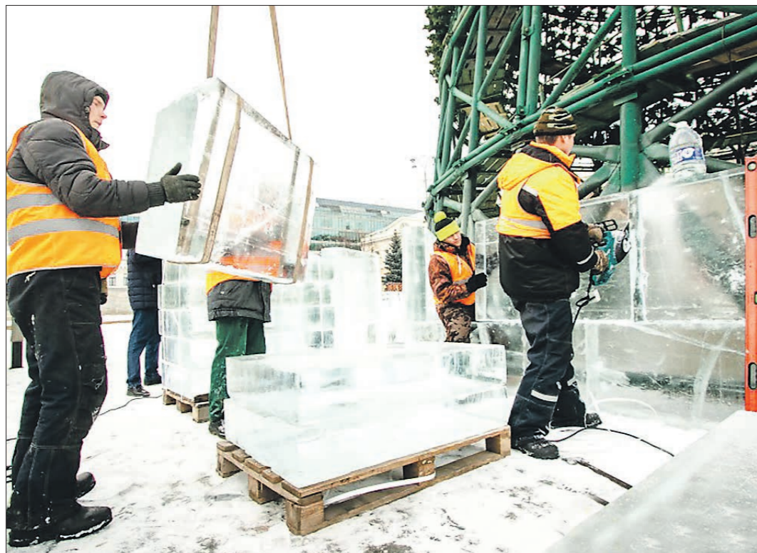
Ледяное лего: собираем Новый год

В Нижнем Тагиле идёт строительство ледового городка на Театральной площади.