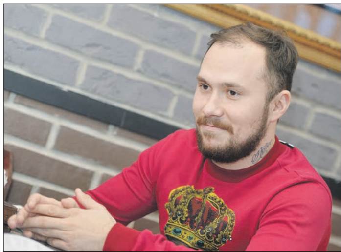
Форвард «Автомобилиста» в прошлом сезоне набрал 27 очков