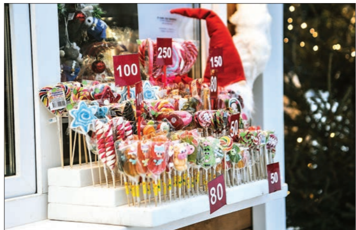
Для кого-то ярмарка начинается со сладкого

Екатеринбург - универсальные и сельскохозяйственные ярмарки на ул. Владимира Высоцкого, 12а; ул. Баумана, 48 / пер. Черноморский, 2; на ул. Санаторной, 3; на пересечении улиц Вильгельма де Геннина и Краснолесья (с 8:00 до 22:00).