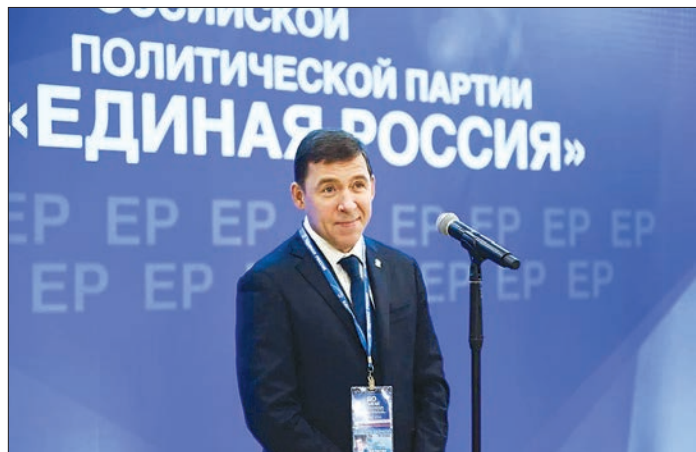
Евгений Куйвашев анонсировал кадровое обновление в региональном отделении «Единой России»

Эксперты сходятся во мнении, что назначение губер-