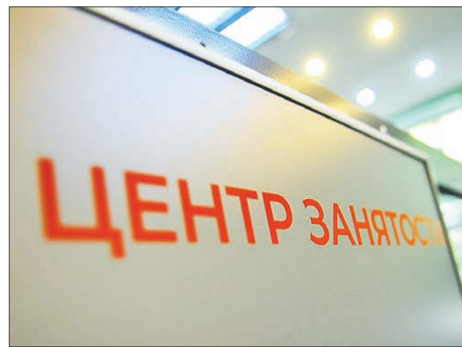
В службах занятости Свердловской области сейчас зарегистрировано более 24 тысяч безработных граждан

Как сообщили в пресс-службе Правительства РФ, в январе 2021 года Средний Урал отчитался о перевыполнении целевого показателя по восстановлению численности занятого населения. Однако, начиная с февраля, число занятых снизилось более чем на 30 тысяч человек. Это и отдалило регион от достижения целевого показателя.