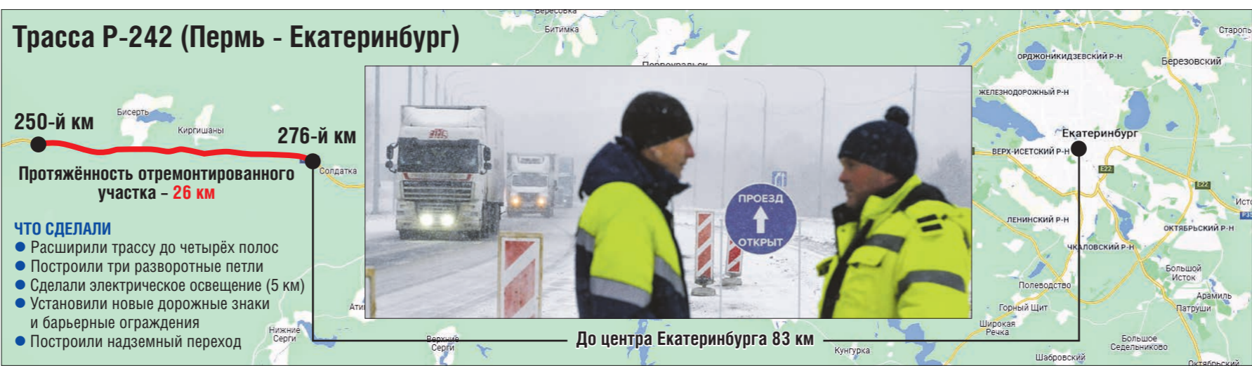
Трасса Р-242 (Пермь - Екатеринбург)

В Свердловской области завершился капитальный ремонт участка федеральной трассы Р-242 Пермь – Екатеринбург в районе Бисерти (в 2024 году этот фрагмент дороги станет частью строящейся магистрали Москва – Казань – Екатеринбург). Теперь жители Перми, Казани и других крупных городов к востоку от Екатеринбурга смогут добраться до уральской столицы очень быстро.