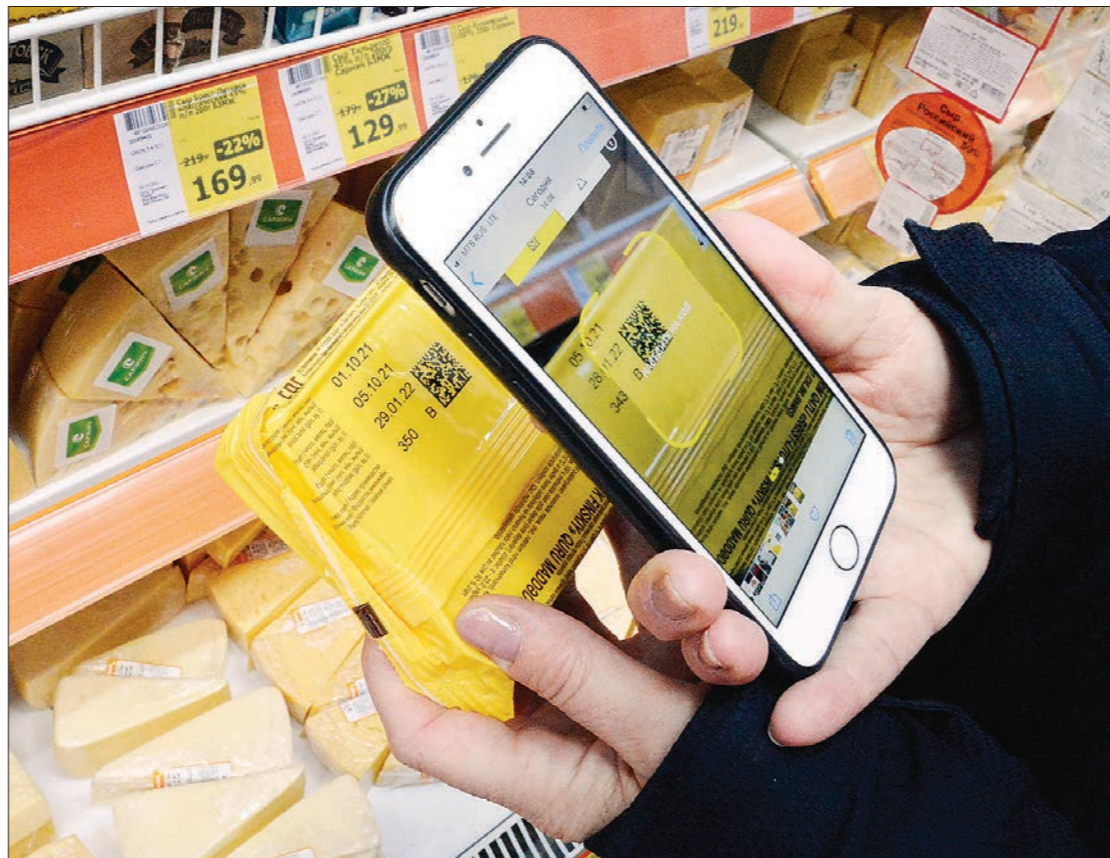
Журналисты «ОГ», пройдясь вдоль прилавков с молочной продукцией, обнаружили, что маркировка на сырах есть, но на тех, что расфасованы в магазине – нет. В «Честном знаке» «ОГ» пояснили, что нарушения здесь нет – код ставится только на единицу продукции

Для крестьянских фермерских хозяйств и сельскохозяйственной сделана небольшая поправка: для них маркировка станет обязательной с 1 декабря 2022 года. Магазины об этом знают, и им разрешено допустить такую продукцию до прилавков.