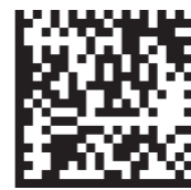
Data Matrix-код и QR-код: похожи, но не одинаковы