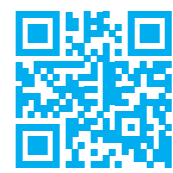
Data Matrix-код и QR-код: похожи, но не одинаковы