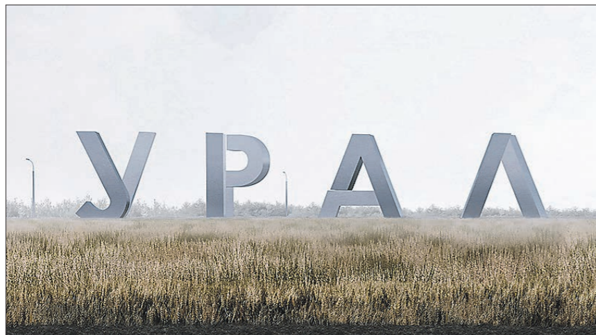
Команда конкурсантов считает, что стела у Кольцово должна быть в виде надписи «Урал», так как именно Екатеринбург называет себя столицей Урала

Конкурс на разработку эскизного проекта архитектурно-пространственной композиции у международного аэропорта Кольцово имени А.Н. Демидова объявили в октябре. Разработчики должны были учесть в проекте исторические особенности столицы Урала, вклад промышленников Демидовых, присвоение Екатеринбургу статуса «Город трудовой доблести», а также то, что в 2023 году город отметит 300-летие.