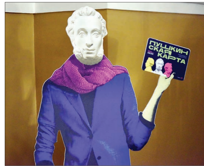
Афишу и список учреждений, участвующих в программе, можно посмотреть на сайте КУЛЬТУРА.РФ

Однако в списке учреждений не было кинотеатров и цирков. Просмотр фильмов, судя по поручению главы государства, должен быть доступен меньше чем через две недели (цирковые пред-