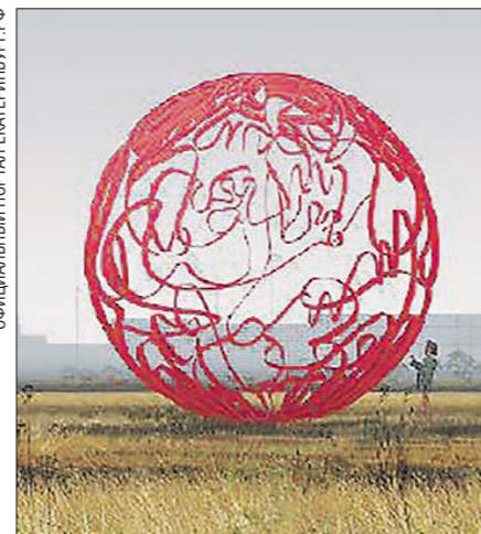
ООО «Мегабудка» концепцию своего проекта не объясняет