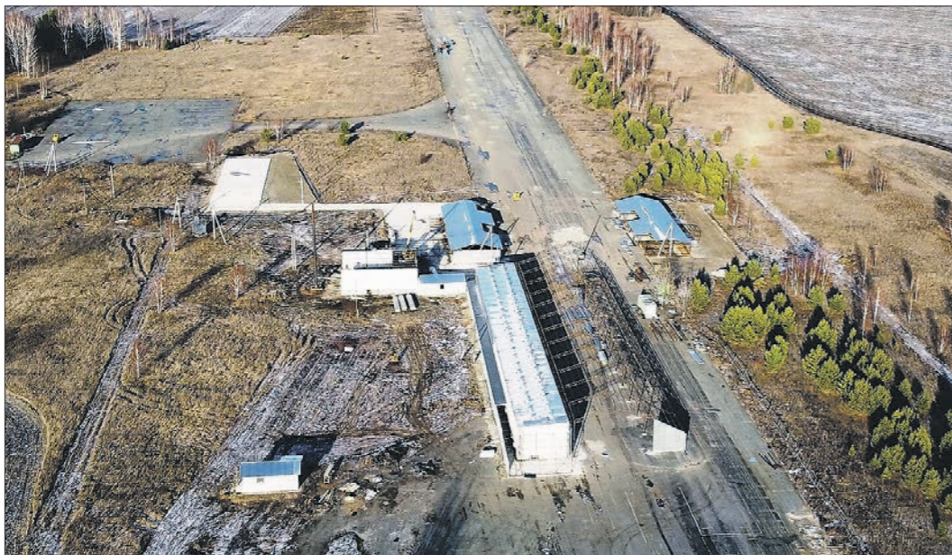
Ангары устанавливаются прямо на бетонном покрытии бывшей взлётно-посадочной полосы, это бытовки-временники

Аэропорт с 800-метровой взлётно-посадочной полосой появился на въезде в Красноуральск (село Приданниково) ещё до Великой Отечественной войны, пишет городской портал KSK66.ru. Он принимал самолёты Ан-2 и вертолёты Ми-8 из свердловского аэропорта «Уктус». Аэропорт был востребован: от уральской столицы до города – 200 с лишним километров, на машине ехать почти три часа, а лететь на самолёте – меньше часа. Регулярные рейсы совершались до 2000-х годов, а потом всё рухнуло – компанию «Второе свердловское авиапредприятие», которой принадлежал красноуральский аэродром, признали банкротом. Спасти воздушную гавань вызвался один из красноуральских предпринимателей – в 2012 году он выкупил площадку, сделал к ней дорогу, небольшое здание вокзала и заявил, что будет возрождать малую авиацию, а также устраивать авиапрогулки и прыжки с парашютом для всех желающих (естественно, за плату). Но только на оформление всех разрешительных документов у бизнесмена ушло два года. В итоге предприниматель