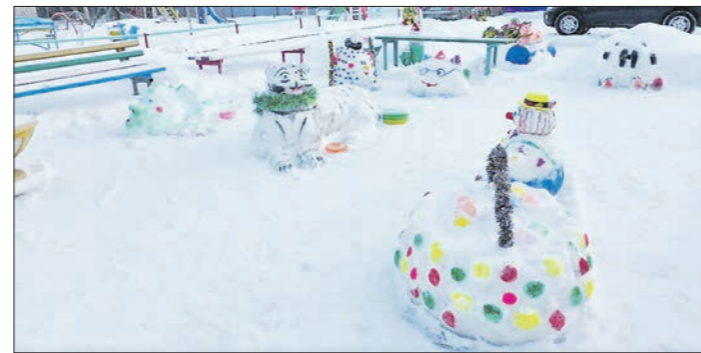
Каждую зиму Тамара Панкратова создаёт во дворе настоящую сказку для местной детворы