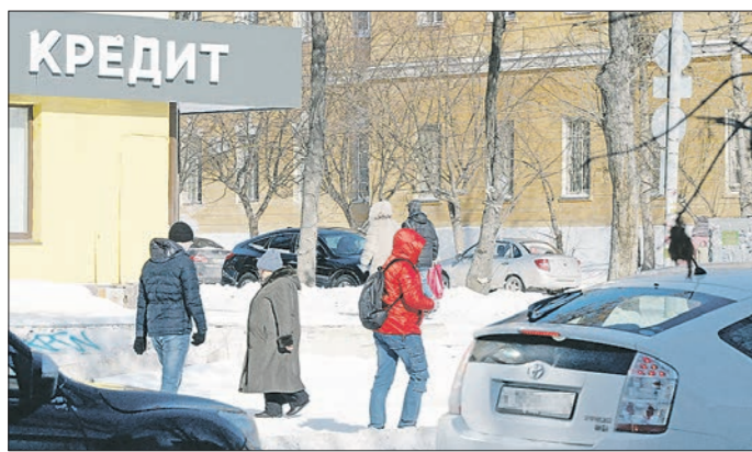
С конца декабря кредиторы больше не смогут навязывать клиентам ненужные услуги