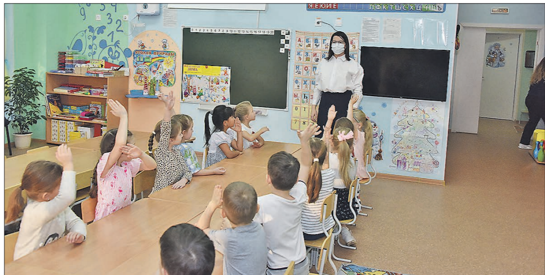
Перед школой ребёнка важно научить не бояться проявлять активность, сосредотачивать внимание на учителе