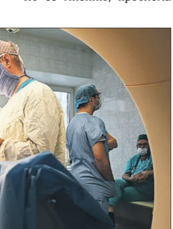
В день открытия школы «живой хирургии» врачи УНИИФ провели показательную операцию на позвоночнике

Сейчас подростковый возраст удлинняется. Некоторые специалисты определяют его с 11 до 20 и даже до 25 лет.