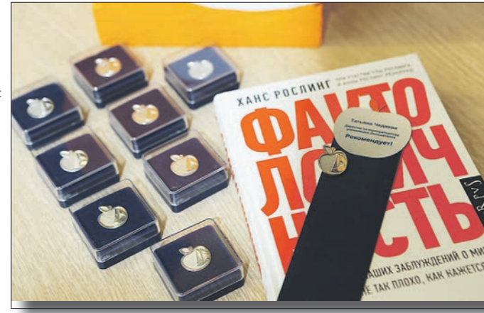
Перед защитой проектов участниками вручили значки с символической конференцией — яблоком

курсанты берутся за решение сложнейших задач, хотя они в профессии совсем недавно.