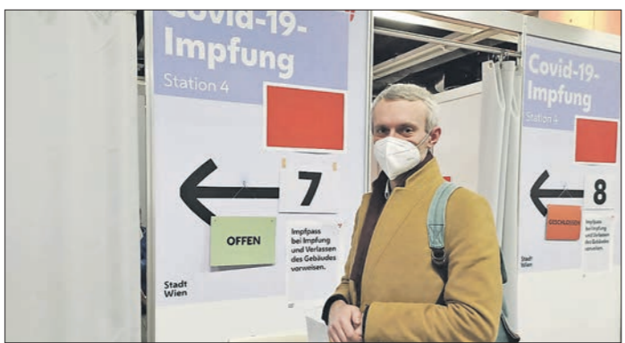
Весь процесс вакцинации в Австрийском конференц-центре занимает около двух часов.

В ноябрьские праздники в российском туризме намечалась новая тенденция: десятки тысяч наших граждан отправлялись в Европу не за привычным отдыхом в средневековых замках или горных шале, а за тем, чтобы поставить себе иностранную вакцину от коронавируса.