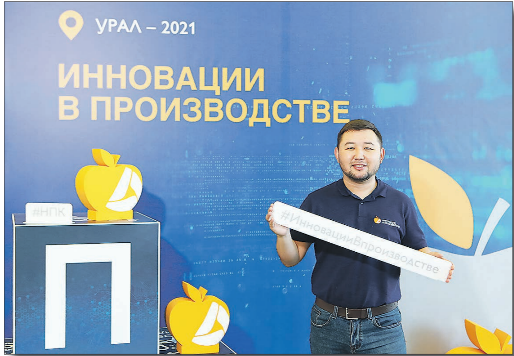
В перерывах участники конференции могли сфотографироваться на память