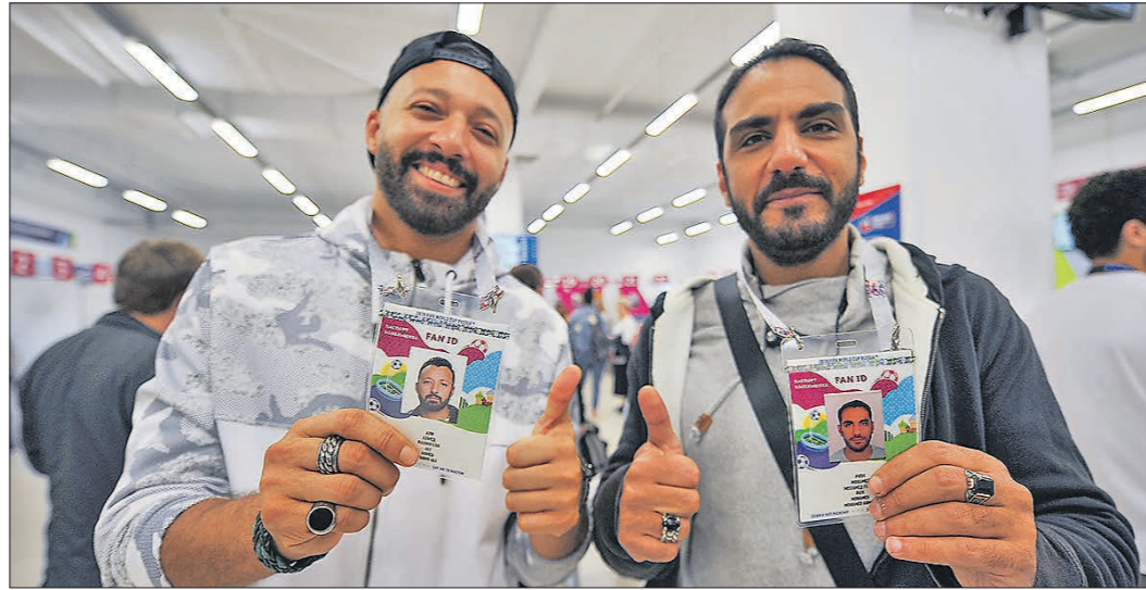
Во время чемпионата мира по футболу паспорт болельщика был и визой, и «проездным» на поезда и городской транспорт

Во-вторых, сейчас внутрироссийские соревнования крайне редко сопровождаются какими-то беспорядками или скандалами.