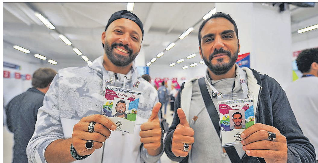
Во время чемпионата мира по футболу паспорт болельщика был и визой, и «проездным» на поезд и городской транспорт

Во-вторых, сейчас внутрироссийские соревнования крайне редко сопровождаются какими-то беспорядками или скандалами.