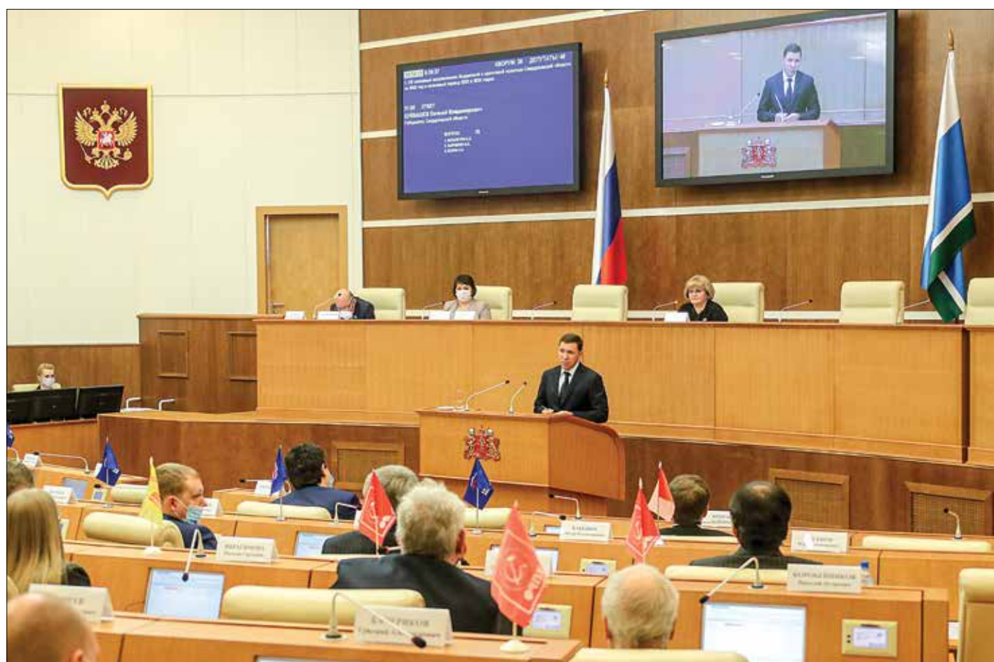
ПРЕСС-СПИСК ЗАКОНОДАТЕЛЬНОГО СОБРАНИЯ СВЕРДЛОВСКОЙ ОБЛАСТИ