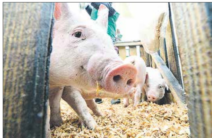
Распространение африканской чумы свиней может привести к тому, что поросята вообще исчезнут с подворий населения

Уже почти полтора месяца на Среднем Урале борются с африканской чумой свиней (АЧС) — грозным заболеванием животных, поражающим свиней и кабана.