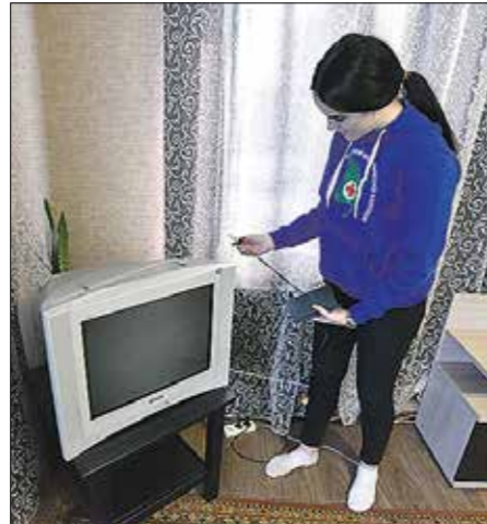
Молодым людям нередко приходится помогать с настройкой телевизора пожилым

Вопросы, связанные с оказываемыми Ростелекомом услугами и недовольством компаний, увь, периодически поступают в редакцию «Облгасеты». И нам удаётся помочь читателям разобраться с этими неурядицами (см. «ОГ» №147 от 13.08.2020, №127 от 16.07.2021).