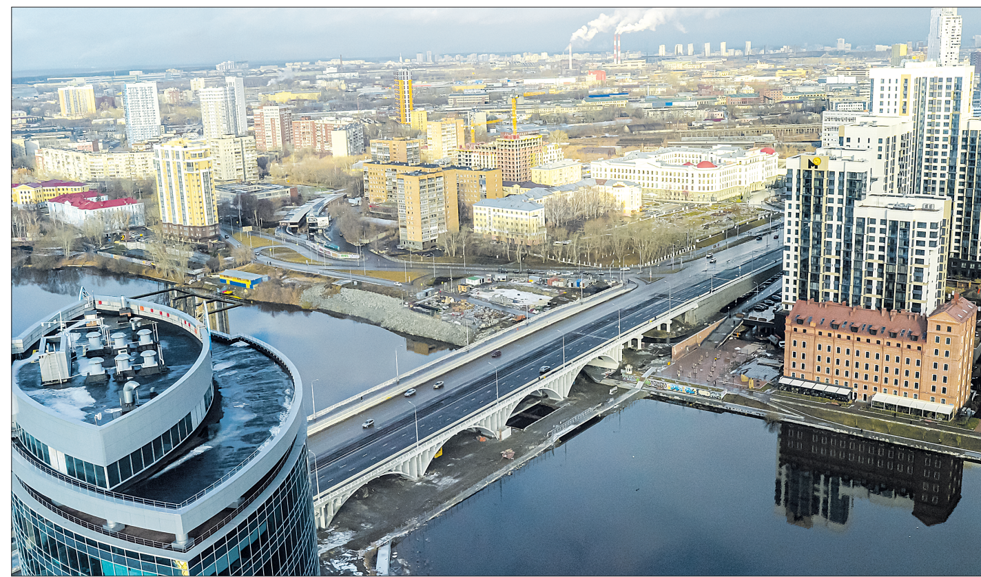
В Екатеринбурге запустили полноценное движение транспорта по Макаровскому мосту. Его реконструкция превратилась в настоящую эпопею – работы вели при трёх руководителях города