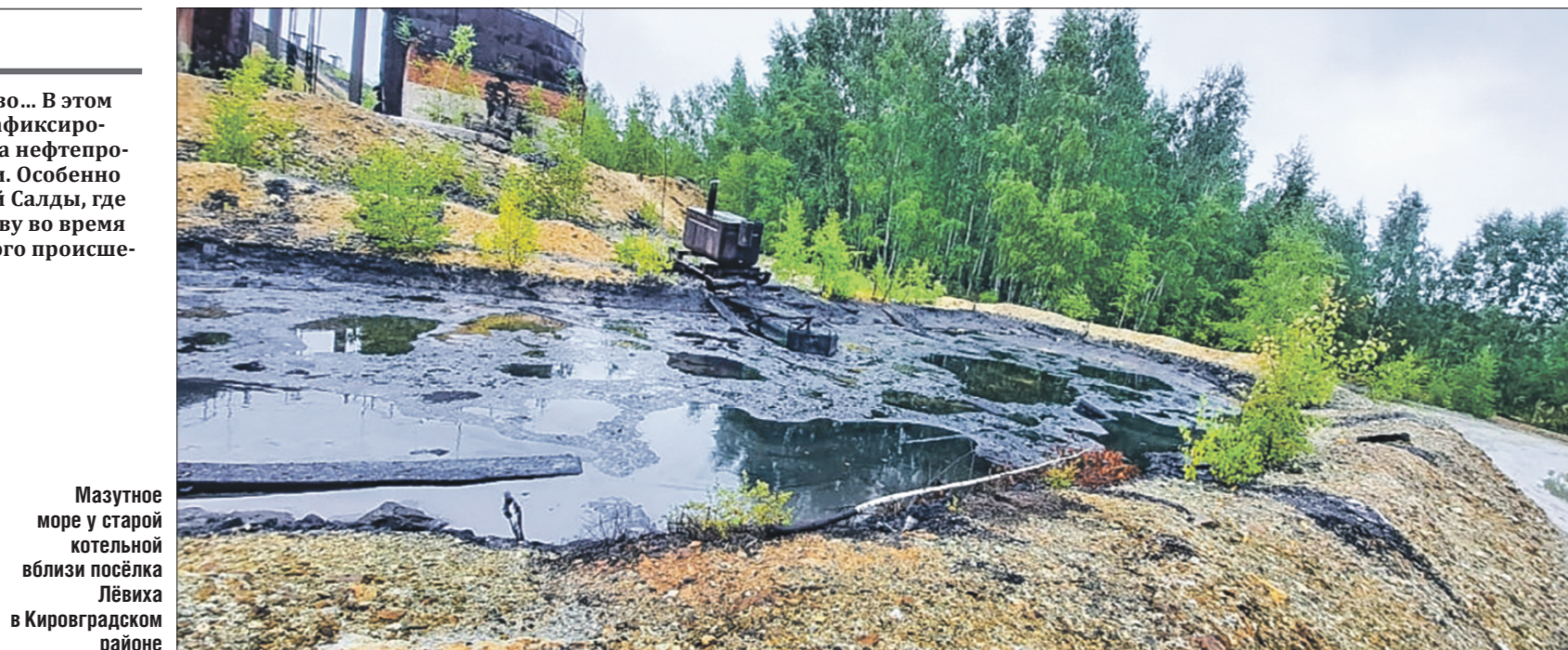
Мазутное море у старой котельной вблизи посёлка Лёвиха в Кировградском районе

Но больше всего не повезло соседям Горноуральского – жителям Верхней Салды. Мало того что из-за обильных осадков там произошло наводнение (на территории ввели ЧС), так ещё в почву попал мазут. Как рассказали в городской мэрии, после прорыва дамбы затопило старый железобетонный завод. Предприятие давно не работает, но его площадка за два с лишним века основательно пропиталась нефте-