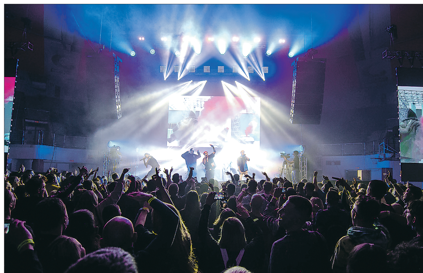
На рэп-сцене, расположенной в ДИВСе, выступили «Каста» и «ЛСП», и, как видно на снимке, на площадке был аншла

Почему обсуждения самого массового музыкального фестиваля в Екатеринбурге не утихали несколько дней?