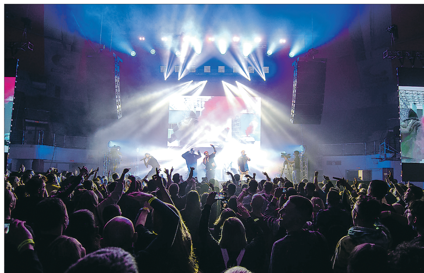
На рэп-сцене, расположенной в ДИВСе, выступили «Каста» и «ЛСП», и, как видно на снимке, на площадке был аншла

Почему обсуждения самого массового музыкального фестиваля в Екатеринбурге не утихали несколько дней?