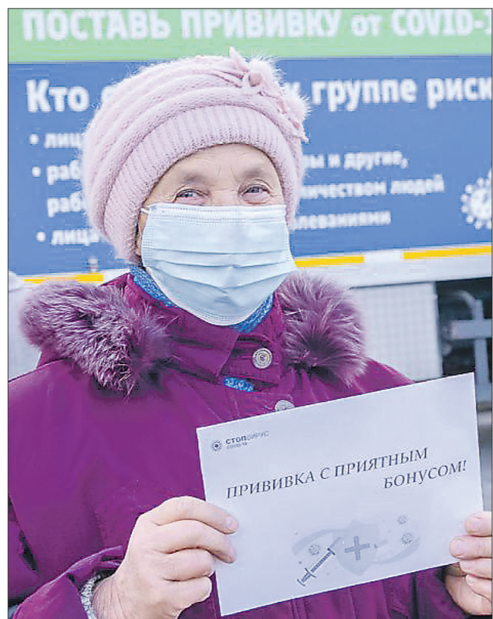
Первый розыгрыш призов в Нижнем Тагиле: приятный бонус к прививке получили 10 горожан

В акции участвуют все, кто привился с 1 февраля до 5 декабря 2021 года. Розыгрыш состоится 7 декабря 2021 года.