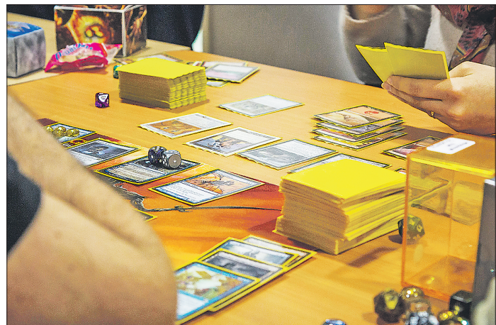
Так выглядит поле боя в настольной карточной игре «Магия».

По данным исследовательской компании NPD Group, которая изучает рынок настольных игр в России с 2014 года, спрос на настольные игры по сравнению с допандемным 2019 годом вырос аж на 43 процента. Эксперты связывают это с ограничениями в сфере развлечений из-за коронавируса и диковицей моды на настольки. «ОГ» решила разобраться, кто играет в настольные игры, как проходят профессиональные турниры и есть ли у этих игр потенциал стать признанными видами спорта.