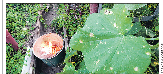
Разжигание костра — не самый эффективный способ дезинфекции теплицы