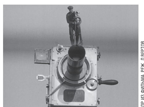
Знаменитый кадр из фильма «Человек с киноаппаратом»

Сегодня на фестивале будут показаны шесть выпусков киножурнала «Кино-правда» (1922), после которых искусствовед Евгений Фатеев расскажет о влиянии советского авангарда на кинематограф. Завтра, 24 октября, впервые в Екатеринбург-