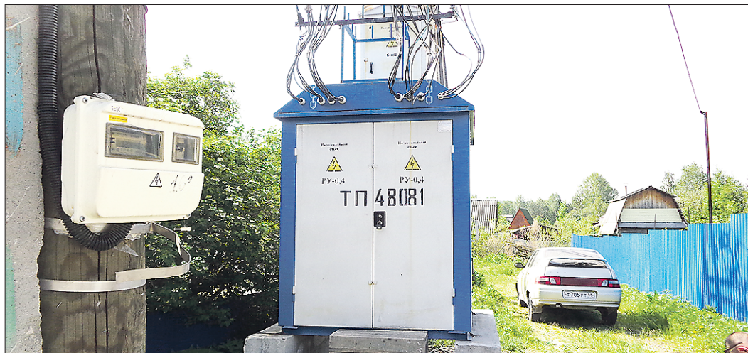
СНТ вынуждены за свой счёт модернизировать систему электроснабжения, а теперь их лишают дешёвого тарифа